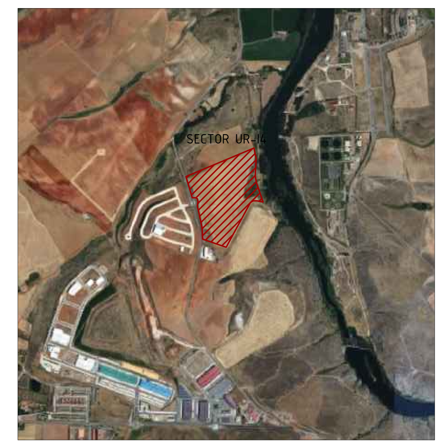
LOCALIZACIÓN DEL SECTOR DENTRO DEL MUNICIPIO DE DOÑINOS DE SALAMANCA